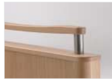
Griffleiste aus Massivholz

225 kg sichere Arbeitslast, 4-geteilte Liegefläche, elektrisch verstellbar