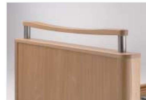
ergonomisch geformte Griffleiste