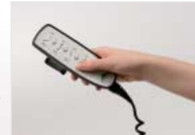
24 Volt-Antriebssystem mit selektiv-sperrbarem Handschalter

Seitengitter Schutzhöhe von ca. 45 cm für Matratzen bis max. 23 cm