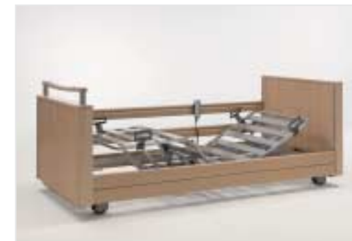
Unterschenkellehne manuell einstellbar