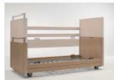
Liegehöhenverstellung von ca. 22 - 77 cm, Verstellbereich = 55 cm