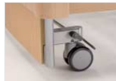
Paarweise Rollenfeststellung in jeder Liegeflächenposition

Trotz 55 cm Höhen-Verstellbereich niedrige Holzhaube im ansprechenden Wohndesign